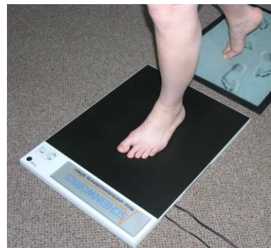
tenzometrická deska Schein